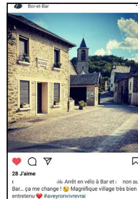
Vu sur le net

La municipalité tient à remercier toutes les personnes qui plantent, qui fleurissent leur maison ainsi que les abords pour leur plaisir mais aussi pour le plaisir des passants. Il est très agréable d'entendre dire que notre village est beau et bien entretenu.