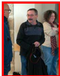
Animations du Pays Najacois en faveur du Téléthon.

Merci à vous tous pour votre générosité.